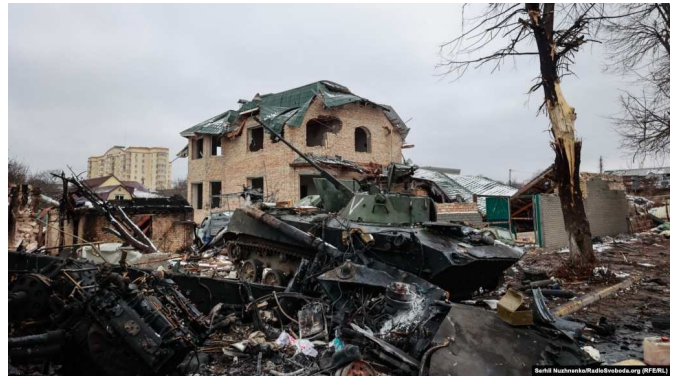
Російське вторгнення в Україну принесло смерть та руйнування. На фото: місто Буча, Київська область, 1 березня 2022 року

З огляду на це дуже актуальною є стаття-роздуми Олега Романчука – дитячого психіатра, психотерапевта, директора Українського інституту когнітивно-поведінкової терапії та Інституту психічного здоров'я УКУ – про психологічну стійкість в умовах війни, яку ми пропонуємо увазі читачів "АМ".