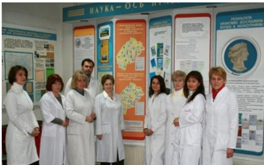
Колектив кафедри 2014 року.