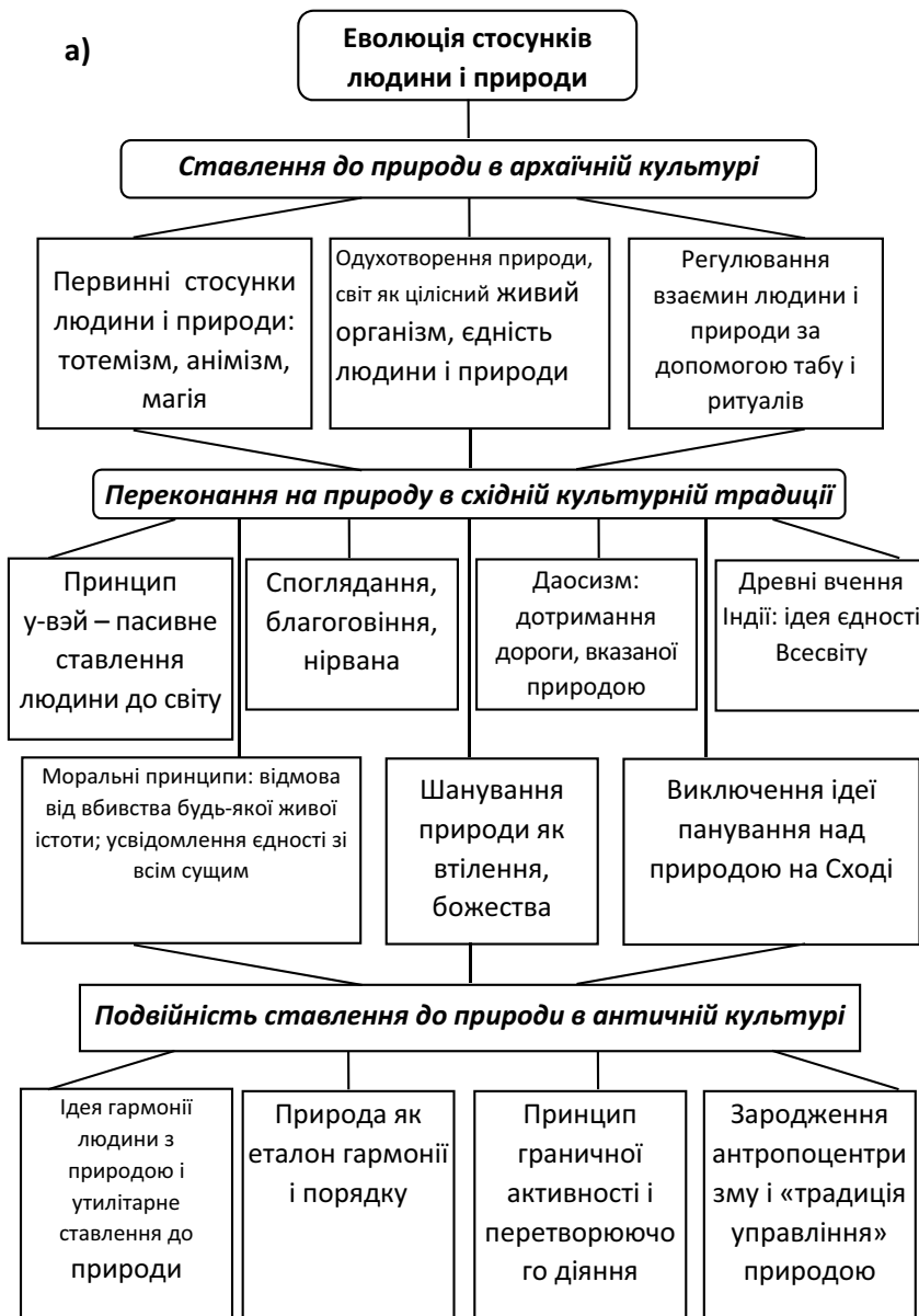
Рис. 2. (а) Еволюція стосунків людини і природи (початок)

Епоха Відродження повертає людину до природного світовідчуття, але тут наявна не статична гармонія людини і природи, а динамічна, де людина намагається підпорядкувати собі природу. У свідомості більшості людей досліджуваного періоду в поясненні взаємодії людини до природного світу в основному панували релігійні уявлення. У філософії Нового часу розвивалися такі гуманістичні ідеї: природна і політична рівність людей (Т. Гоббс, Ж. Руссо, К. Гельвецій, Франсуа Марі Аруе Вольтер); творча активність (Спі-